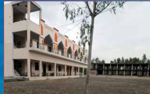
श्री गुरु रविदास धर्म अस्थान, सिरसगढ़, अम्बाला ( हरियाणा )