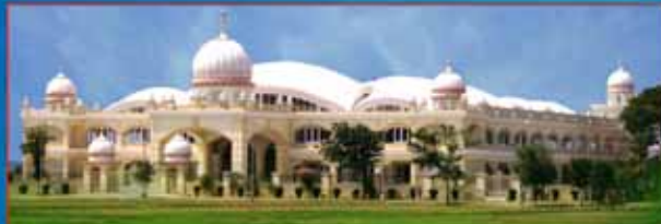
श्री गुरु रविदास सत्संग भवन, डेरा सच्चखण्ड बल्लां ( जालन्धर ) के दर्शन-दीदार।