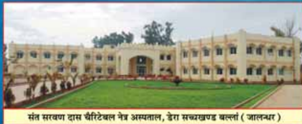
संत सरवान दास चैरिटेबल नेत्र अस्पताल, डेरा सच्चखण्ड बल्लां ( जालन्धर )