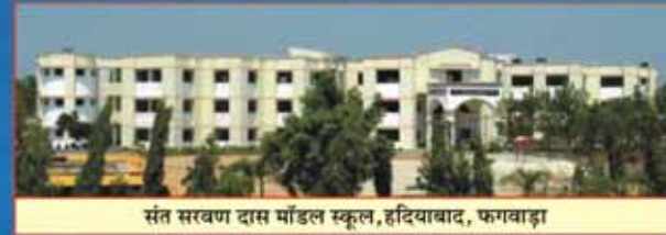
संत सरवान दास मॉडल स्कूल, हदियाबाद, फगवाड़ा