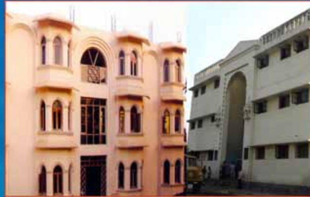
श्रद्धालुओं के निवास के लिए बनाया गया भवन तथा श्री गुरु रविदास लंगर हाल, सीर गोवर्धनपुर खाराणसी