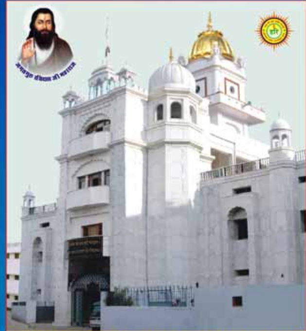
SHRI GURU RAVIDASS JANAM STHAN MANDIR (U.P.) Managed by : Shri Guru Ravidass Janam Sthan Public Charitable Trust H.O.:-Dera Sachkhand Ballan, Jalandhar (Pb.)