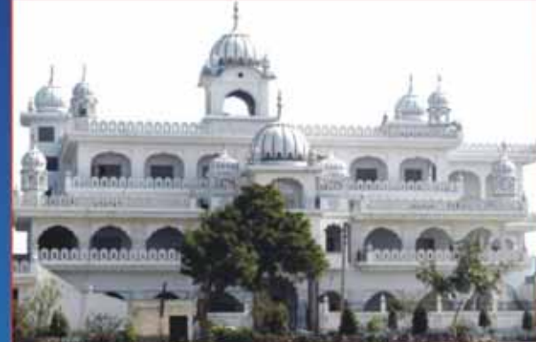
श्री गुरु रविदास धर्म अस्थान, हदियाबाद फगवाड़ा के दर्शन-दीदार।