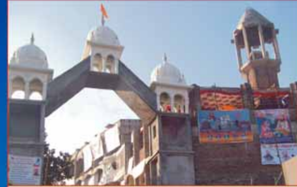
श्री गुरु रविदास धर्म अस्थान, कात्रज, पूना ( महाराष्ट्र )