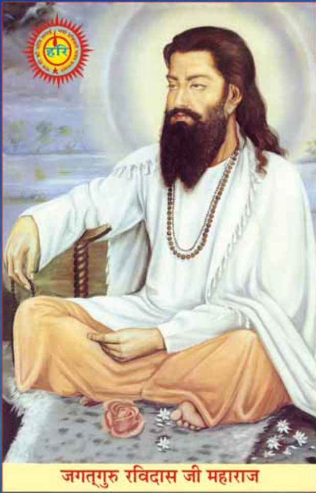
जगतगुरु रविदास जी महाराज