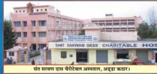
संत सरवान दास चैरिटेबल अस्पताल, अड्डा कठार।